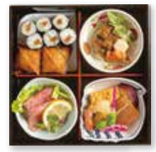
◆ローストビーフ入り ※写真のご飯は「助六寿司」です。