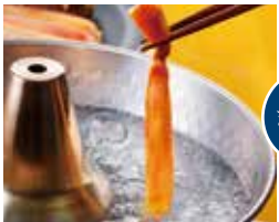
◎ 海鮮しゃぶしゃぶ ※いずれも写真はイメージです