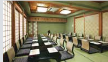
◆ 有楽 織部の間 [16~28名様]