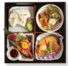
◆お刺身入り ※写真のご飯は「白米」です。