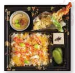
■二段/蟹炊き込みご飯