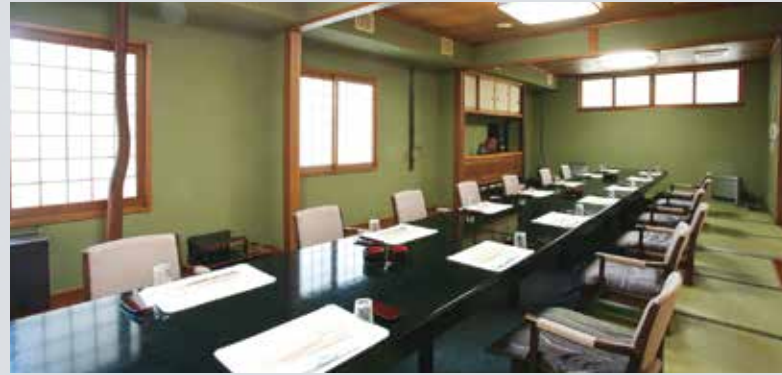
◆ 兼六の間(掘炬燵) [10~18名様]

ご利用人数に合わせた会食場をご用意いたします。 また、お歳を召した方にも安心な掘炬燵式の個室、 大人数にも対応可能なお座敷など、和やかな時を お過ごしいただけるお部屋をご用意しております。 どうぞお気軽にご相談ください。