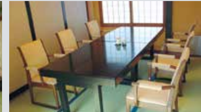
◆ 桃山の間(椅子席) [4~6名様]