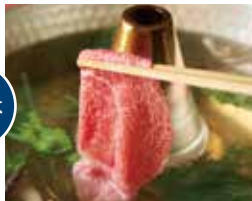
◎ 黒毛和牛サーロイン しゃぶしゃぶ